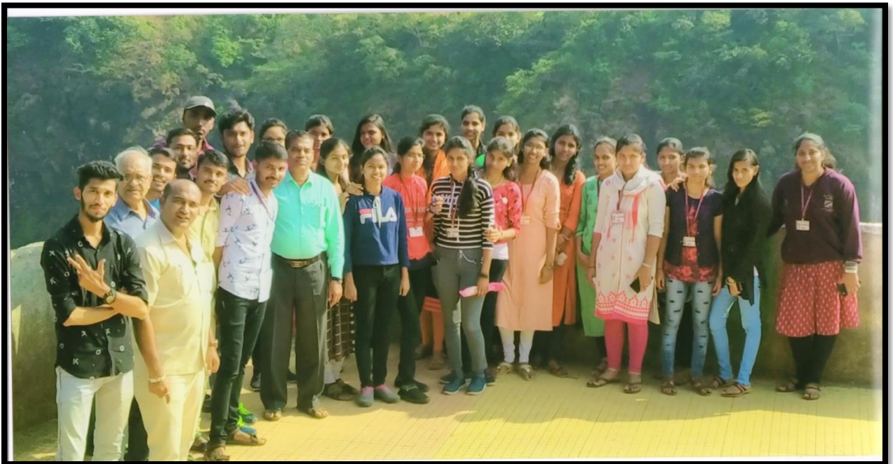
Students & teachers at Thoseghar Waterfall