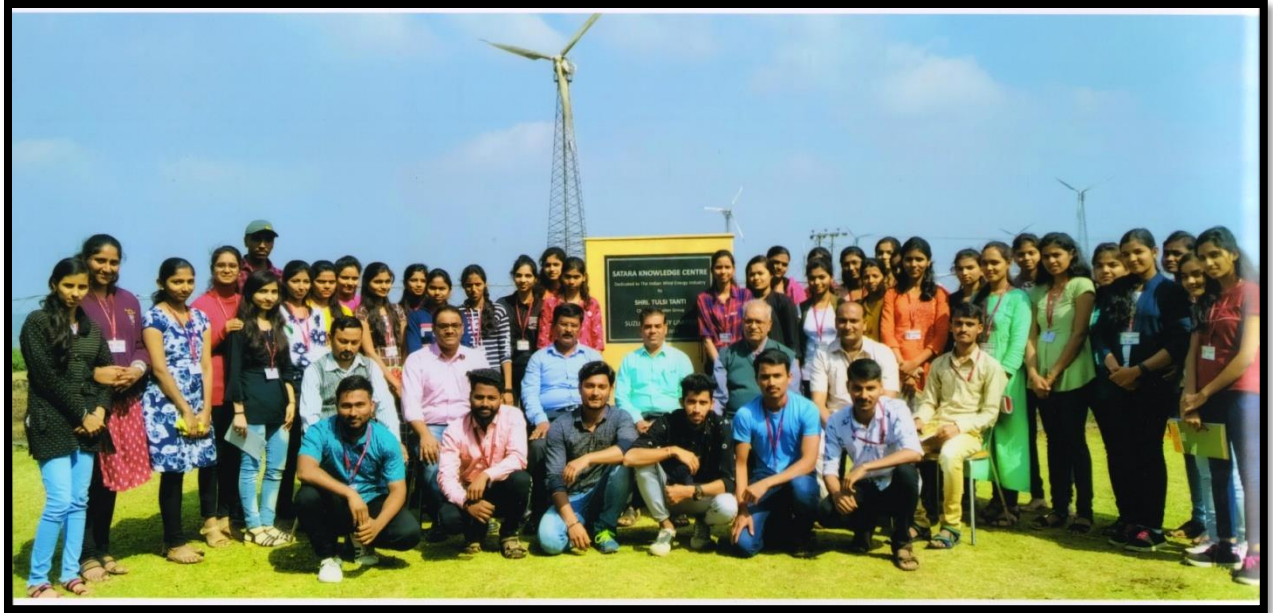
All Students & teachers with Staff of Suzlon Wind Mill, Chalkewadi (Satara)